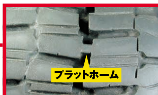
残り溝深さが「プラットホーム」に達していると冬用タイヤとして使用できません。