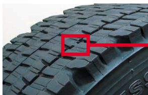
プラットホームとは新品時の溝深さから50%の位置にあるゴムの盛り上がりを設置した部分。