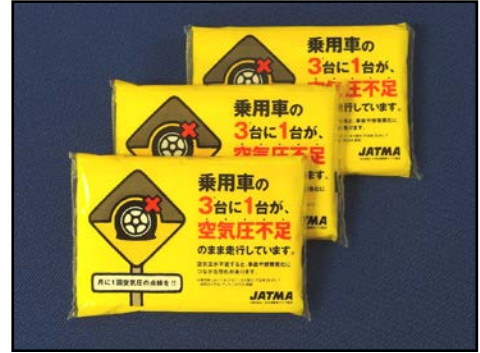
ポケットティッシュ